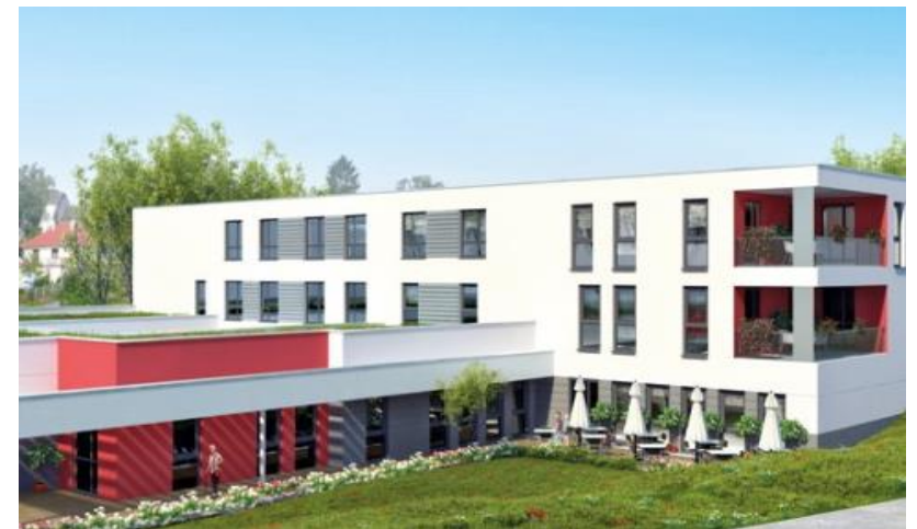
LE VIEILLISSEMENT EN CHAMPAGNE-ARDENNE À L'HORIZON 2040