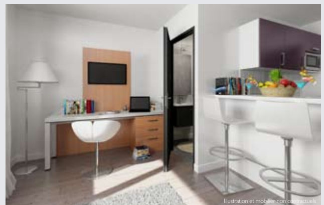
Illustration et mobilier non contractuels