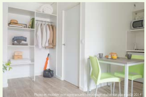
Photo et mobilier non contractuels - reportage réalisé sur place août 2014