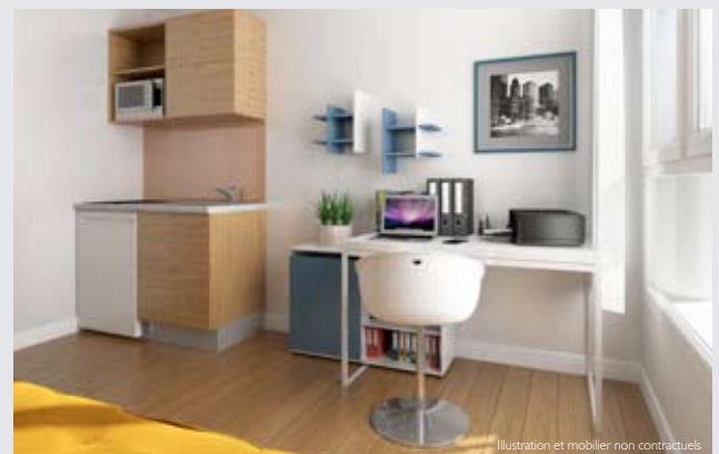
Illustration et mobilier non contractuels